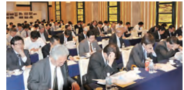
昨年の春季ガスセミナーのもよう